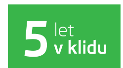
Předplacený servis na 5 let / 100 000 km při financování od ŠKODA Finance